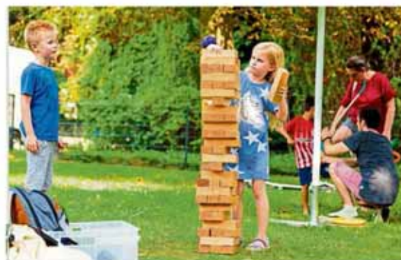
Ein Spieleparcours mit einem Riesen-Jengatum, aufgebaut vom Rüsselsheimer Verein Auszeit, sorgt bei den kleinen Besuchern von Volk im Schloss für Unterhaltung.