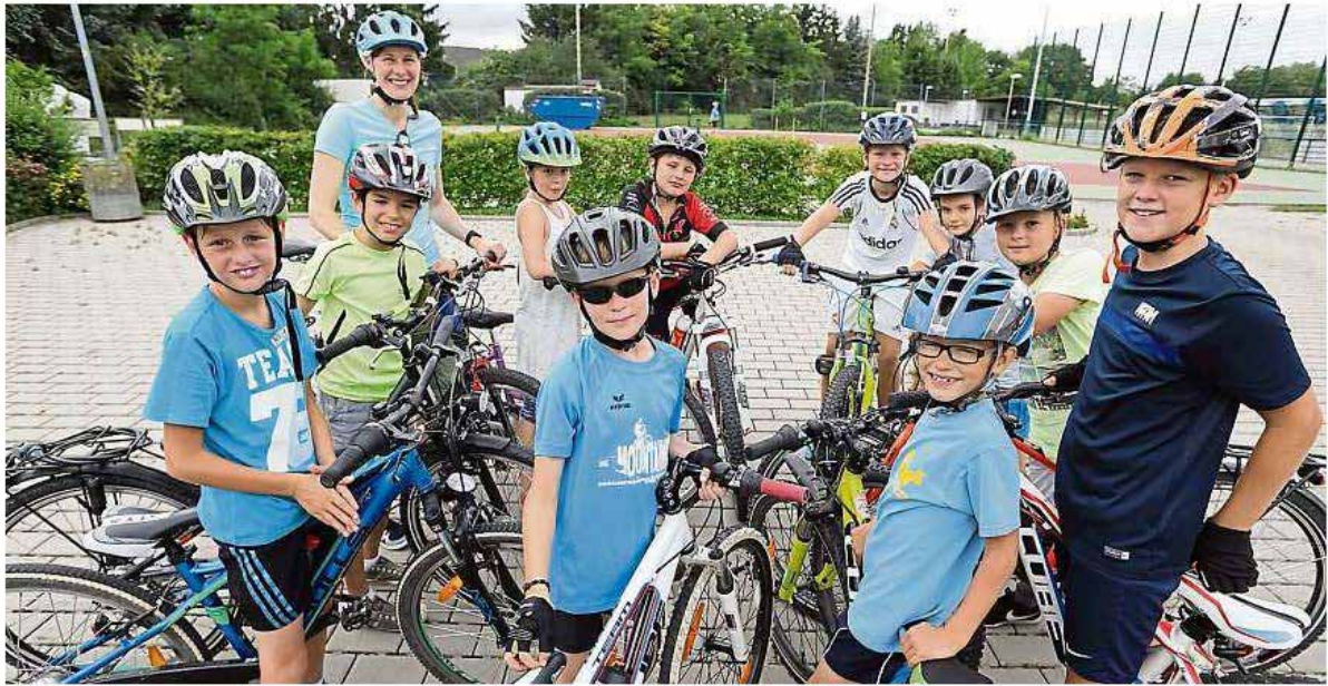
Der Bike-Workshop von Auszeit soll Kinder aufs Fahrrad bringen und ihnen Mut und Sicherheit vermitteln.