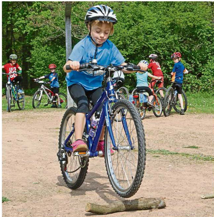
Bei einem Bike-Workshop konnten die Kinder ihr Balancegefühl testen.