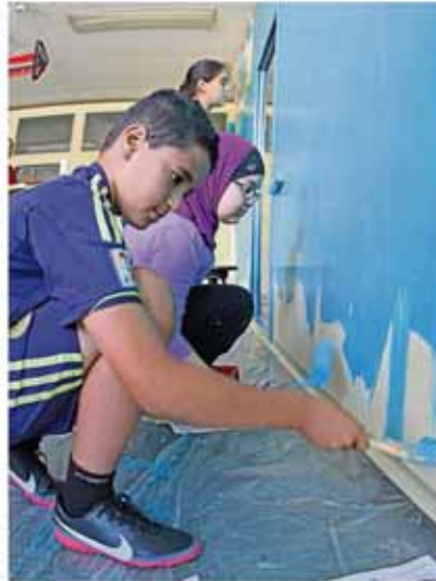
Beim Auszeit-Ferienangebot haben die Organisator:innen wieder alle Engster gezogen. Auf dem Programm stehen Ausflüge, beispielsweise zum Wasserspielplatz in Mainz (rechts oben), dem Odewald in Felsensommer (rechts unten). Aber auch für den eigenen Jugendtreff im Berliner Viertel soll wieder ein Arbeitsanreiz gesetzt werden – natürlich steht die Spaß im Vordergrund.

Am Standort Berliner Viertel geht es in den ersten vier Ferienwochen rund. Los geht es mit einem Einführungstreff am 1. Juli, ab 15 Uhr bei dem das Sportmobil am Start ist und der Grill angeheizt wird. Der erste Ausflug führt die Teilnehmer am 5. Juli dann nach Mainz zum Kletterpark „Clip'n'Climb“. Einen Tag später führt eine Gruppe dann zu den Wasserspielen nach Frankfurt. Schwarzwald-Minispiel wird am 10. Juli in Mainz gespielt, am 12. steht ein Besuch im Frankfurt Zoo an. Am 13. wird im Treff Mariniade geübt. Die dritte Ferienwoche hält eine Projektwoche in eigener Sache bereit. Unter dem Motto „Unser Treff soll schöner werden“, wird die Einrichtung vom 17. bis 19. Juli wieder auf Vordermann gebracht. In der vierten Woche geht es Montag, 24. Juli, zum Volkspark nach Mainz und an Dienstag, 25. Juli, können Mädchen bei einem Kreativworkshop ihrer Fantasie freien Lauf lassen. Tags darauf sind die Auszeitler im Oberwaldhaus Darmstadt der Natur auf der Spur.