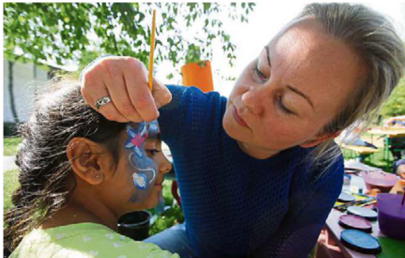
Mitarbeiter der Goetheschule schminken Kinder beim „Sportsfunfestival“. Austoben können sich die kleinen Besucher beim „Sumo-Ringen“ und Kistenklettern.