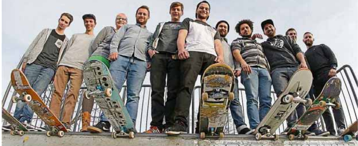
Guter Dinge sind die Mitglieder des neuen Vereins „B! Skateboarding Rüsselsheim am Main“.

FREIZEITSPORT Mitglieder des neuen Vereins „B! Skateboarding“ wollen auch den Nachwuchs fördern