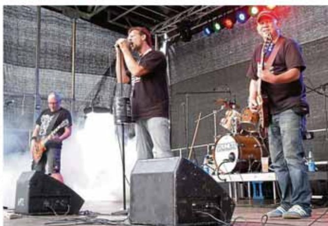
Handkäs' Side und die Bretzelsänger gehören zu den Lokalmatrosen auf dem Festival Bühnen.

Bei der Auswahl der Bands habe das „Orga-Team“ die Qual der Wahl. Für die dritte Auflage des Festivals auf dem Gelände am Alten Mainzer Weg hatten sich mehr als 200 Musikgruppen beworben. Von den acht Bands, die am Samstag auf der großen, von Tribus-Open-Air ausgelebtem Bühnen aufspielten, waren fünf aus Rüsselsheim. Bekanntester Act waren „Handkäs' Side und die Bretzelsänger“, die am frühen Samstagabend für Stimmung sorgten mit ihrer Mischung aus Funk und Rock mit deutschen Texten, bei dem „Handkäs' und Appeler“ im Mittelpunkt stehen. Dass sich dann ein Großteil der Festivalbesucher nicht aus dem im hinteren Teil des Geländes gelegenen Unterstand wegbewegte, machte mit dem Wollenbruch zu tun gehabt ha-